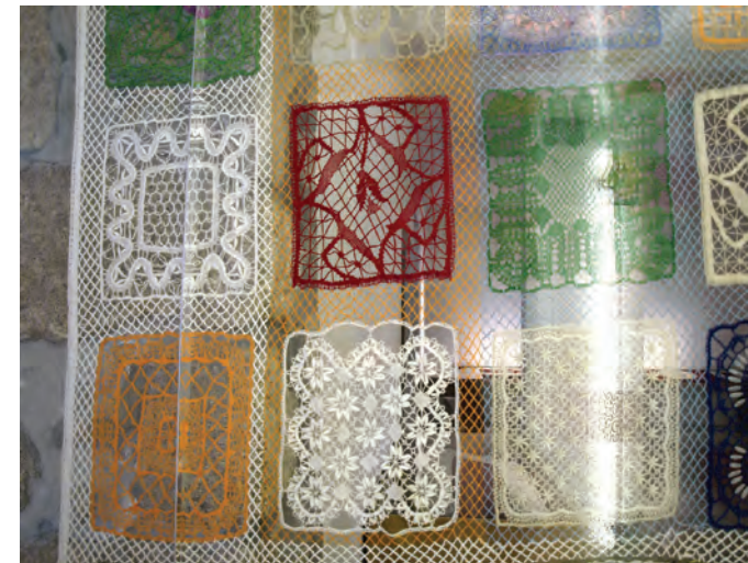
Detail van de vierkanten

Lia Baumeister Open methode: netslag is draaien, kruisen. De paren liggen nu open. Gesloten methode: halve slag is kruisen, draaien. De paren liggen nu gedraaid (ofwel gesloten).