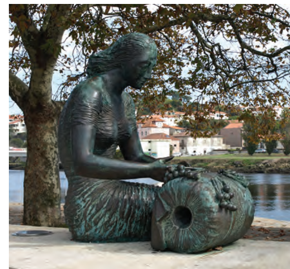
Haven Vila do Conde met beeld van Ilídio Fontes