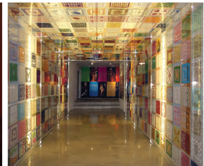
Tunnel in het museum met de kanten werkjes