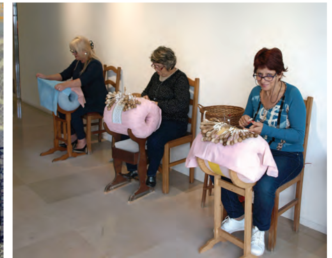
Enkele klossters aan het werk