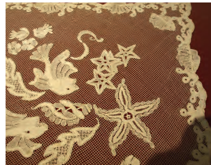
Kant uit Vila do Conde