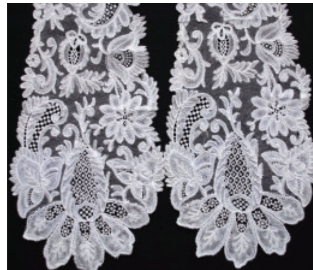
mutsenslip eind 18e eeuw

Havezate Mensinge is ingericht met de oorspronkelijke inventaris. Zo hangen er portretten van bewoners uit de achttiende eeuw. Op deze portretten zijn kanten barbes en cravattes te zien. Hierbij zijn vergelijkbare kanten uit de collectie van de Stichting Cultureel Erfgoed LOKK gezocht. Zo ziet u onder andere fragiele antieke kanten kragen, linten en mutsen.