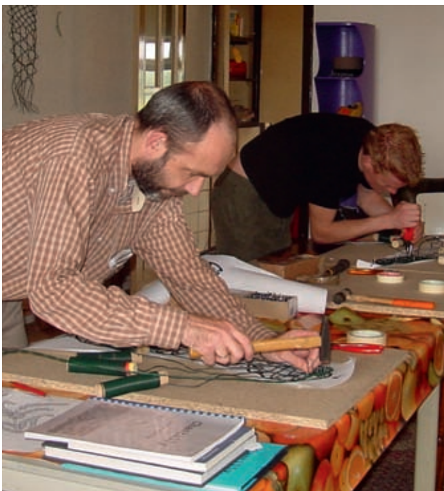
Zo klossen is echt mannenwerk

Er werken 35 mensen in vaste dienst. Voor grote projecten kan de groep uitgebreid worden naar 75. Zij hebben inmiddels zoveel ervaring dat er geen werktekening meer hoeft te worden gemaakt. Na bespreking met de klant wordt op de computer een ontwerp gemaakt. Na goedkeuring wordt dit op doek op ware grootte afgedrukt en naar India gestuurd. Hierop wordt met staaldraad, hamer en spijkers geklost. Door in het ontwerp grijstonen toe te passen, weten de mensen of iets een open of dichte structuur moet hebben. Bij professionele kantmakers worden de motieven door geoefende kantklossers gemaakt en de gronden door de minder geoefenden of machinaal. De motieven worden met de grond verbonden, waarna de grond achter het motief meestal wordt weggeknipt. Dit heet applicatiekant. Hetzelfde gebeurt in India. Het motief wordt met de hand gemaakt, het raster door een machine en dan wordt het motief met het raster verbonden.