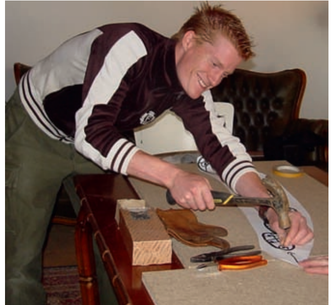
Een speld steken valt nog niet mee