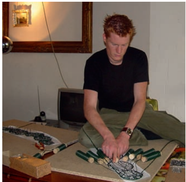
Nog een proefstukje

In 2009 werd de Toon van Tuijl Designprijs toegekend aan Demakersvan voor hun ontwerp van een 1200 m lang gevlochten hekwerk voor het Bijlmer Sportpark in Amsterdam Zuidoost. Deze prijs wordt elk jaar uitgereikt door de Nationale commissie voor internationale samenwerking en duurzame ontwikkeling. De prijs gaat naar het beste ontwerp dat bestemd is voor de westerse markt en eerlijk geproduceerd wordt in een ontwikkelingsland. Het bekroonde hekwerk heet Home Sweet Home. Er zijn tachtig verschillende motieven en decoraties in verwerkt. Deze refereren aan de verschillende culturen die in Amsterdam Zuidoost aanwezig zijn. Dit hekwerk werd in de fabriek in India geproduceerd. Home Sweet Home is een soort ontdekkingsreis. Sommige dingen weet je gelijk: de molen is Nederland, de matroesjka de Sovjet-Unie, de wajangpop is Indonesië en de bever met de maple leaves is Canada. Maar dat de kolibrie voor Jamaica staat en de leguaan voor de Nederlandse Antillen, dat kwam ik pas later te weten.