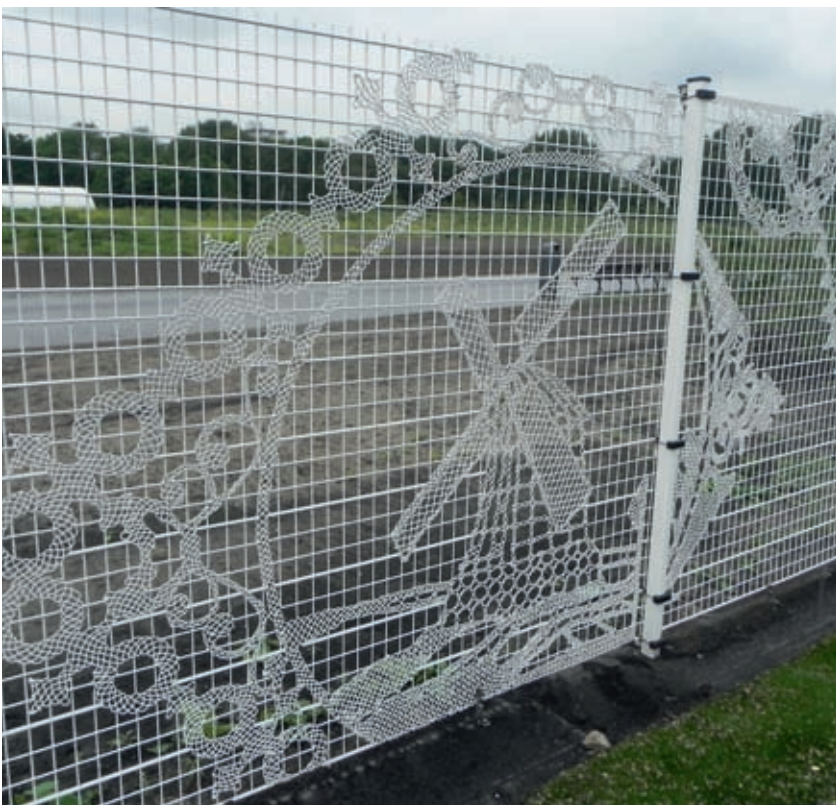
Hek om het Bijlmer Sportpark